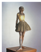
La Petite Danseuse de quatorze ans, 1881